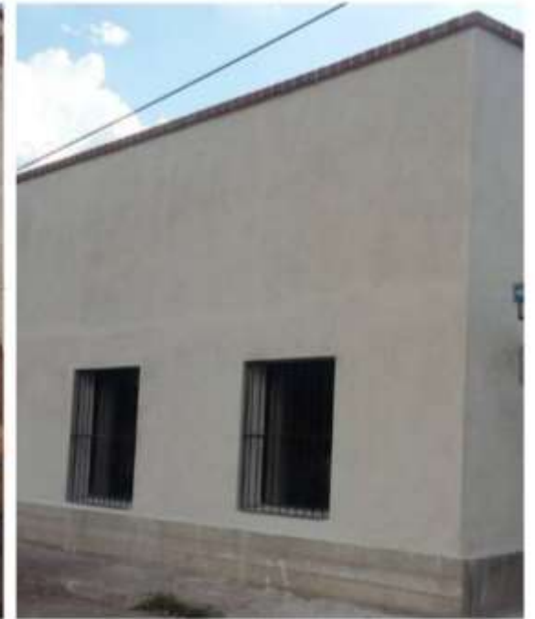
Artistas rescatan residencia en Arizpe para hacerla centro cultural